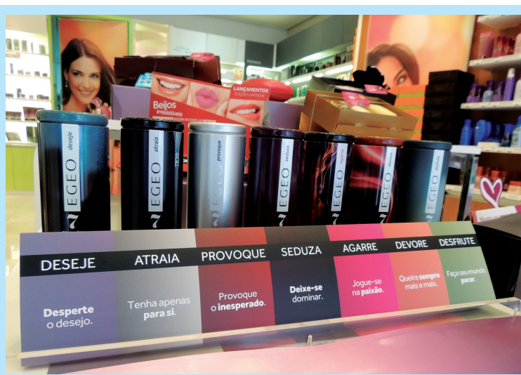
O Boticário conta com uma linha de perfumes que são uma excelente opção de presente para quem quer surpreender

Aproveite a oportunidade e deixe o dia 12 ainda mais especial com as incríveis opções de presentes que o comércio limeirense oferece.